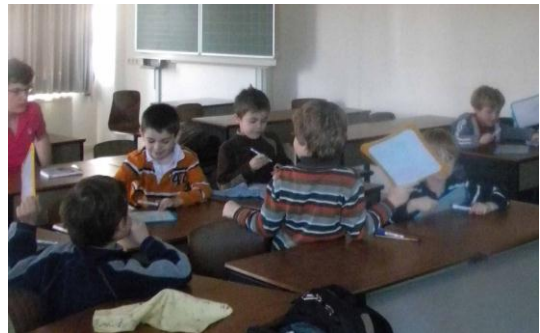
ça remue ...

Pendant la première heure, les petits étaient très enthousiastes et on beaucoup participé. Mais durant la deuxième heure, ils étaient moins concentrés et commençaient à bouger et à papoter. On ressentait leur fatigue : deux heures d'exposés sont très longues pour des enfants de sept ans.